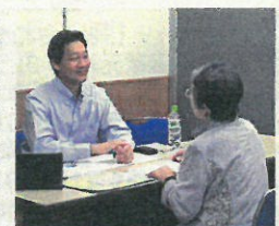
過去に開催した個別相談会の様子

1カ所ですべての問題がクリアに 無料個別相談会も同時開催 ひとつ口に相続といつても、法律、税金、不動産、保険、金融、葬祭、人材育成…と、さまざまな問題が絡んで複雑化し、ここに相談したらよいのかわからない、と頭を抱えている人も多いのでは。相続に関する手続きは手遅れになると、一家や会社を潰しかねません。遺言や生前贈与、事業継承税制をはじめとした相続対策は、まずはしっかりと内容を把握することが大切です。 「おかやま相続フォーラム」では、相続に関する大切な内容を把握することが大切です。